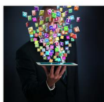
Diferentes identidades parciales en función de las diferentes actividades que desarrollamos online