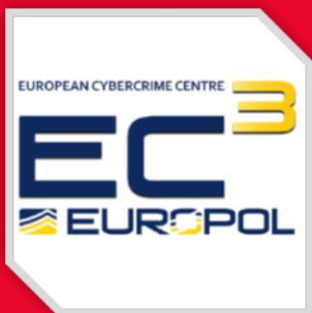
Gonçalo Ribeiro- EUROPOL